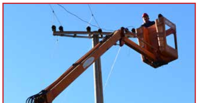
Radnici Službe za održavanje Regiona 3 na terenu