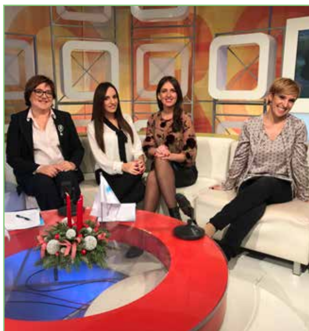
Detalj sa izvlačenja nagrada u RTCG