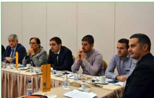
Kolege iz EPCG na seminaru u Budvi