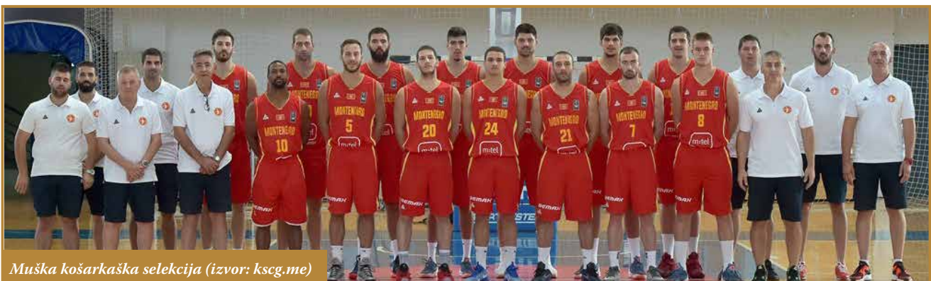
Muška košarkaška selekcija

Sa Elektroprivredom Crne Gore, saradujemo dugi niz godina. Neizmjereno smo zahvalni na pomoći koju nam pružate. Raduje nas što ste u nama prepoznali dobrog partnera, pa kao jedan od glavnih sponzora omogućavate da postizemo vrhunske rezultate. Kao visoko društveno odgovorna firma, očekujemo nastavak saradnje, i još jednom veliko HVALA.